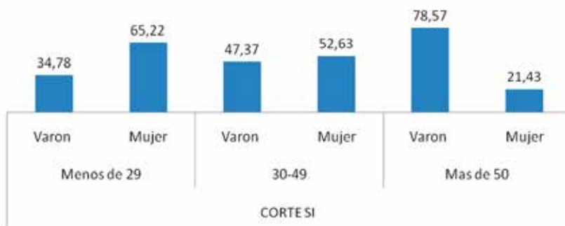
Gráfico N° 4. Género, edad y corte de servicio

FUENTE: Elaboración propia (junio 2013- abril 2014)