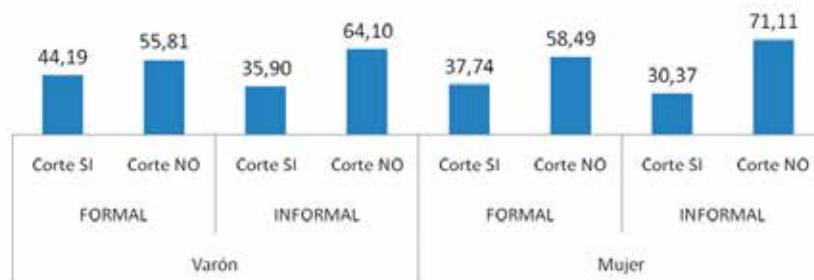
Gráfico N° 3. Género y sector de empleo