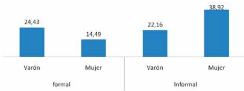
Gráfico N° 2. Género y sector de empleo