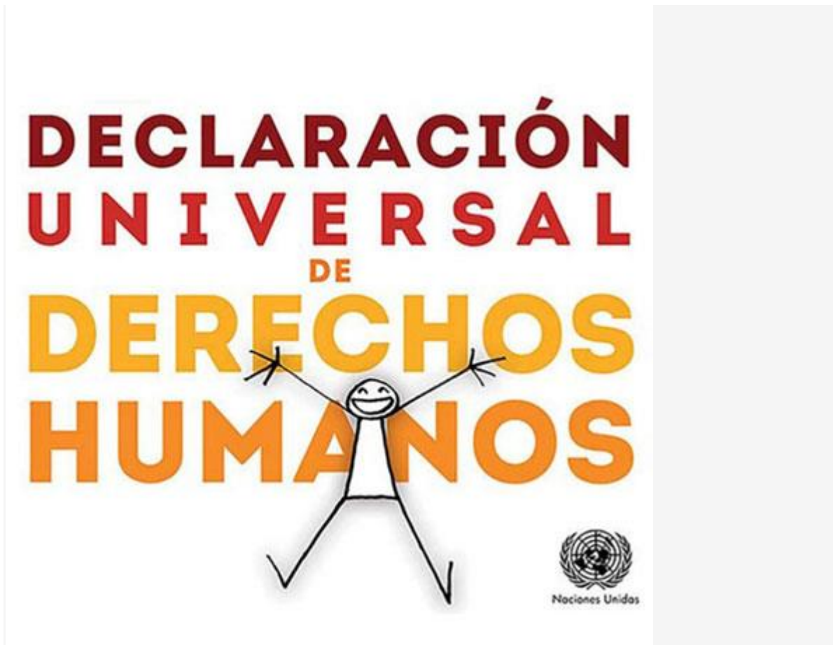
Declaración Universal de los Derechos Humanos